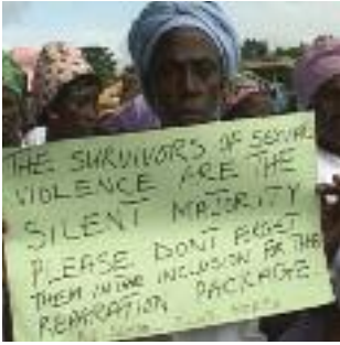
Mujeres activistas en la presentación de un informe de Amnistía Internacional sobre violencia sexual en Sierra Leona.

Declaración de la ONU sobre los derechos de los pueblos indígenas en septiembre de 2007, poniendo así fin a un debate que se ha prolongado durante dos decenios. Dos meses después de que Australia votara en contra de la Declaración, el recién elegido gobierno del primer ministro Kevin Rudd ofreció una disculpa formal por las leyes y políticas de los sucesivos gobiernos que “causaron profundo dolor, sufrimiento y pérdida” a la población indígena aborígen.