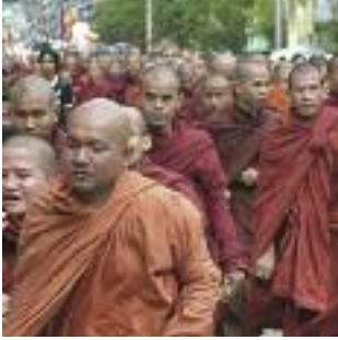
Monjes budistas acompañados de civiles se manifiestan en Yangón.

A la entrada del siglo XXI, los atentados terroristas del 11 de septiembre de 2001 transformaron una vez más el debate sobre los derechos humanos en una discusión divisiva y destructiva entre “occidentales” y “no occidentales”, que restringió libertades y alimentó las sospechas, el temor, la discriminación y los prejuicios entre gobiernos y personas por igual.