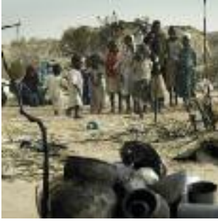
Imagen del campo de refugiados de Kalma, en Nyala,

Darfur Meridional, tras un incendio, en marzo de 2007.