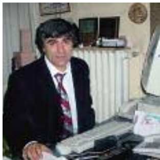
Hrant Dink, periodista y defensor de los derechos humanos turco, resultó muerto a tiros en enero de 2007.

actos en los términos más enérgicos y reforzaron sus embargos comerciales y armamentísticos, pero esto apenas afectó a la situación de los derechos humanos sobre el terreno. En Myanmar seguían detenidas miles de personas, de las que al menos 700 eran presos y presas de conciencia. Entre ellas destacaba Aung San Suu Kyi, galardonada con el premio Nobel, que ha estado 12 de los últimos 18 años sometida a arresto domiciliario.